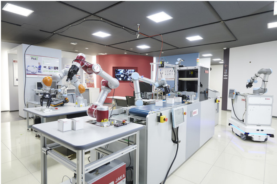
協調安全ロボットテクニカルセンター

愛知県一宮市と東京都品川区には協調安全ロボットテクニカルセンターを設け、取り扱う協働ロボットや周辺機器のデモンストラーション展示のほか、お客様のワーク検証やセミナーを実施しています。